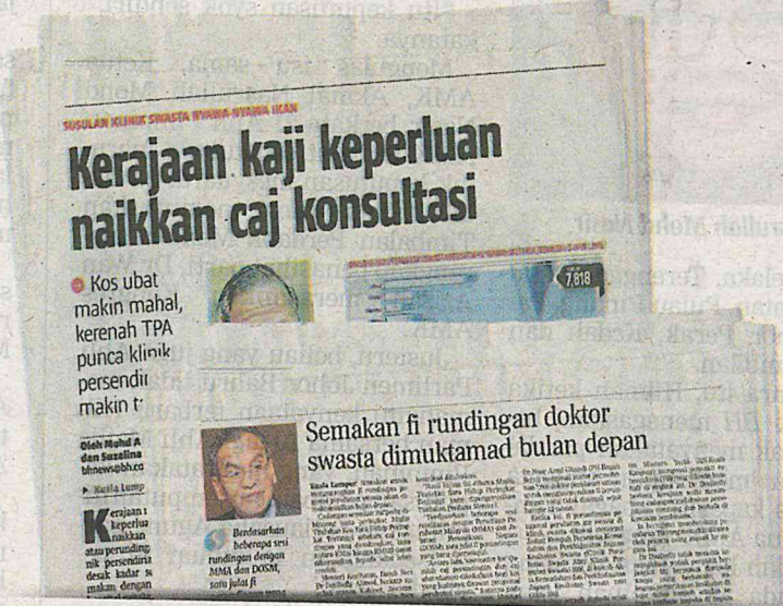
Keratan akhbar BH pada 27 Mei dan 18 Oktober lalu.