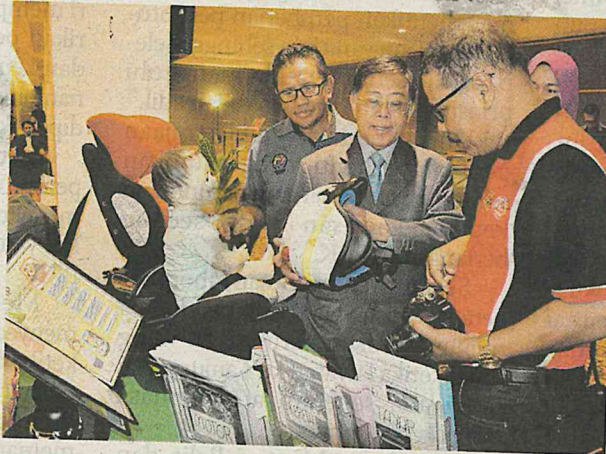
Azih (tengah) melawat ruang pameran selepas merasmikan Seminar Keselamatan dan Kesihatan Pekerjaan di Sektor Awam Zon Selatan 2019 di MITC, Ayer Keroh semalam.

"Memang ada senarai klinik kesihatan harian ini menerima sehingga 1,000 pesakit sehari dan ia jumlah yang agak ramai seperti klinik kesihatan di Ipoh dan Kementerian Kesihatan mempunyai rekod tersebut.